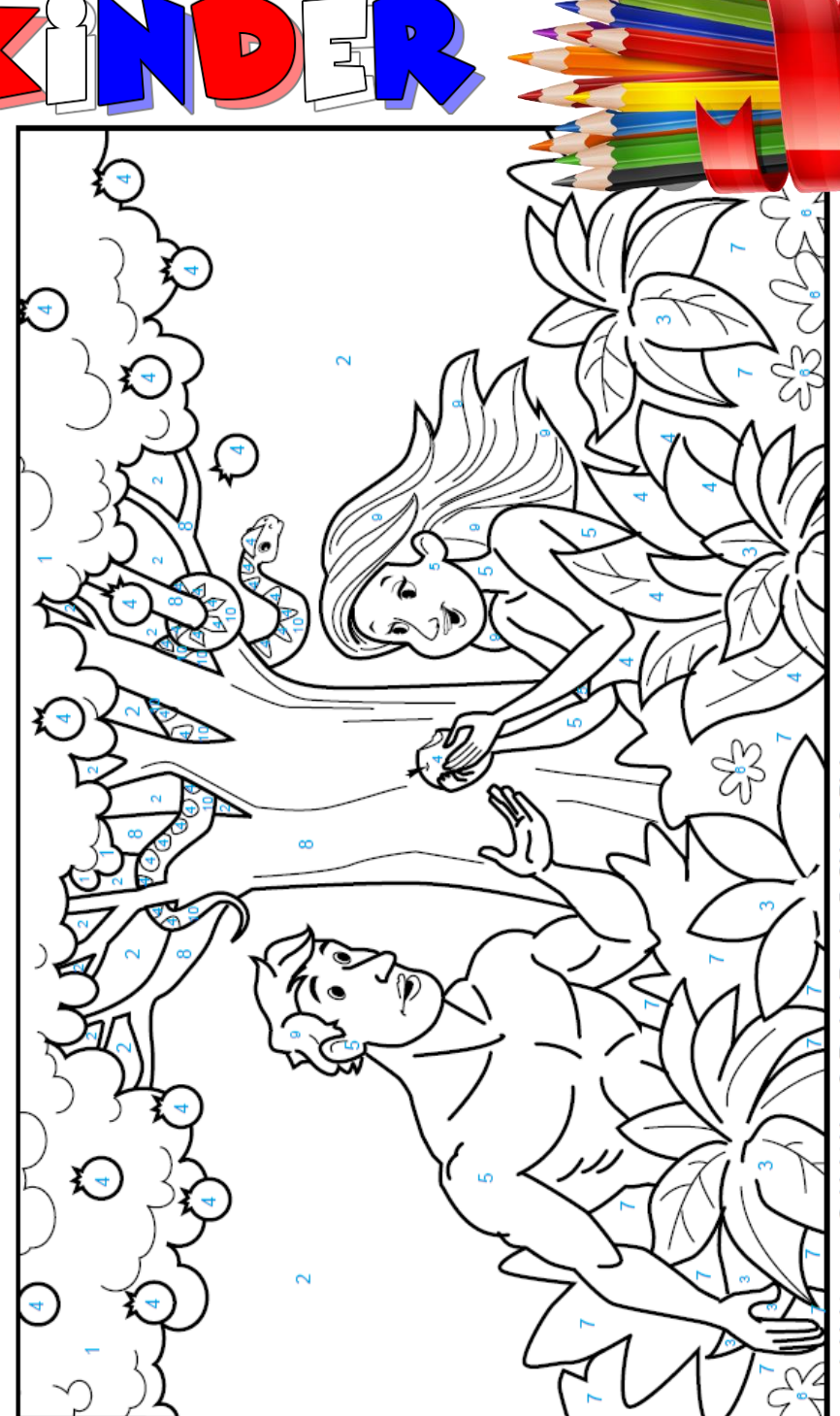
Light green 2. Light blue 3. Red 4. Purple 5. Skin 6. Pink Dark green 8. Gray 9. Dark Brown 10. Orange

Color each section by the colors shown in the list at the bottom of the page. leave unnumbered sections white. If you don't have all of the colors listed make your best color choice.